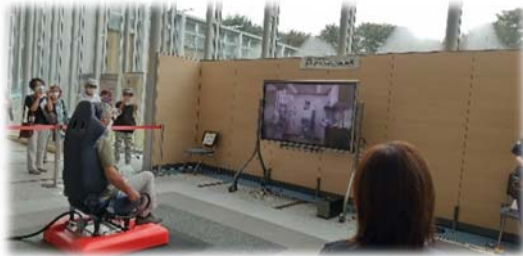
地震座布団体験の様子