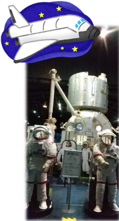
船外活動の様子(宇宙では太陽の光が当たるところは100度以上、当たらないところはマイナス100度以下になるそう)