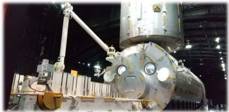
国際宇宙ステーション「きぼう」 日本実験棟の実物大モデル