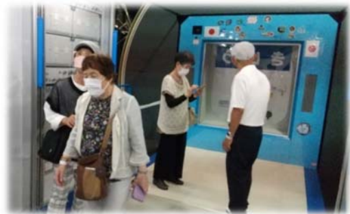
宇宙飛行士になる為の環境適応訓練設備の説明を真剣に聞いている皆さん