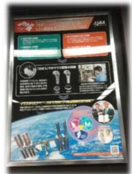
マウスの骨量減少の説明