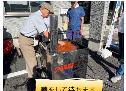
蓋をして待ちます