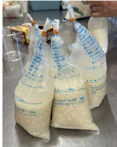
お米と水を線のところまで入れます