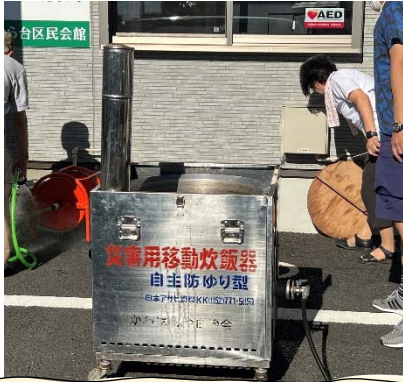
災害用移動炊飯器でお湯を沸かします

定例会終了後、13名が参加し白米の炊き出し訓練を実施しました。お米1合を専用の袋に入れ、沸騰したお湯の中に入れて炊き上げるのですが、美味しく食べることが出来ました。沸かすお湯の量やお米1合に対する水の量、炊いたご飯と一緒に食べられて長期保存できるものには何があるかなど意見を出し合いました。