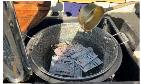
そのままでも食べられる玄米梅がゆを湯煎