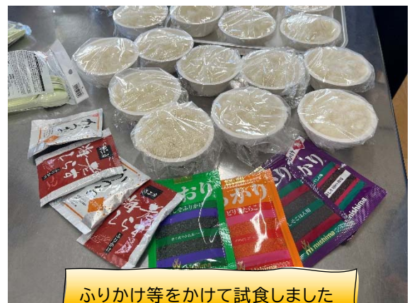
ふりかけ等をかけて試食しました