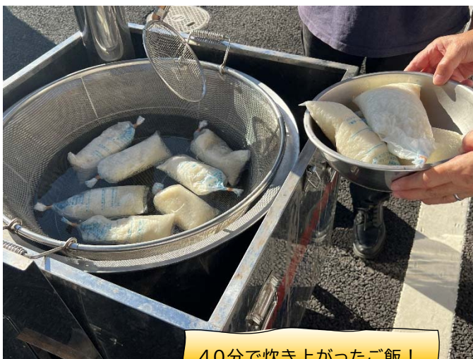
40分で炊き上がったご飯！