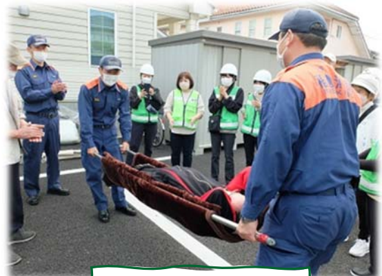
簡易担架搬送訓練